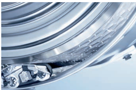
Mielen patentoiman kennorummun ansiosta pestävät tekstiilit pysyvät kauemmin kuosissaan, sillä ne eivät työnnä rummun reikien läpi.