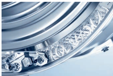
Tavallinen rumpu päästää tekstiiliin kuidut rummun reikien läpi kuluttaen tekstiilejä pesun aikana.