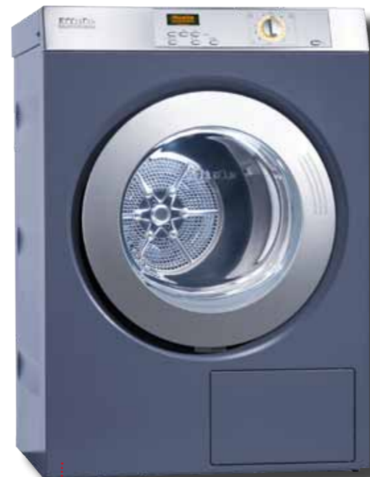
PT 5186 octoplus@ Profiline