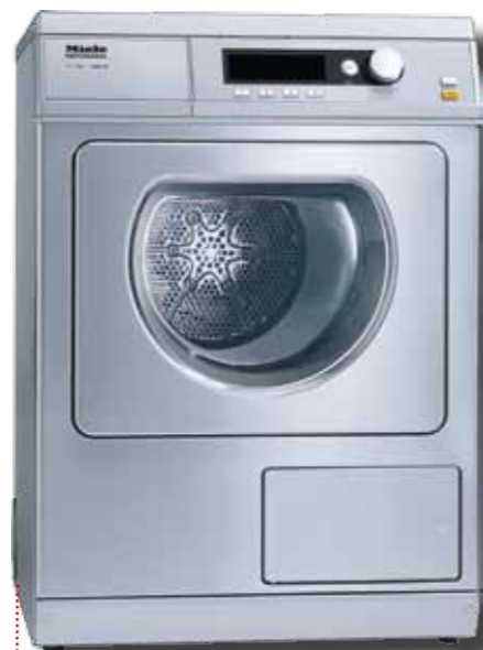
PT 7135C kondenssikuivaaja PT 7136 poistoilmakuivaaja (kuvassa)

Kuivausrummut ovat pääsääntöisesti poistoilmakuivaajia, mutta 6,5 kg kuivausrummuissa on valittavana myös kondensoivat ja lämpöpumpputoimiset mallit. Tämän kokoluokan kuivausrummut voidaan asentaa vastaavankokoisten pesukoneiden päälle torniksi erillisen välirakennussarjan avulla.