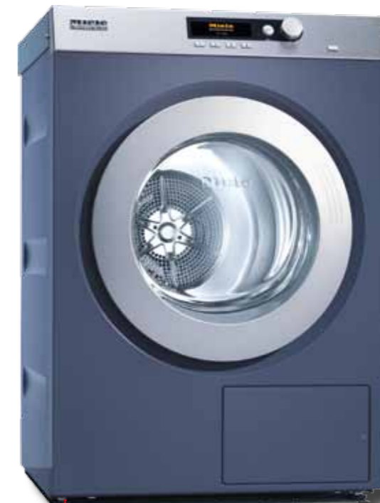
PT 7186 octoplus@