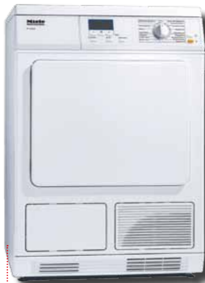
PT 5135C kondenssikuivaaja (kuvassa) PT 5136 poistoilmakuivaaja PT 5137WP lämpöpumppukuivaaja