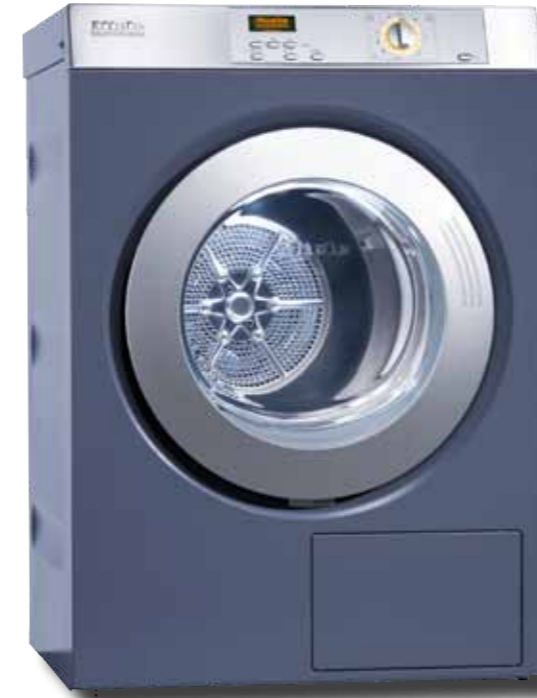
PT 5186 octoplus@ Profiline