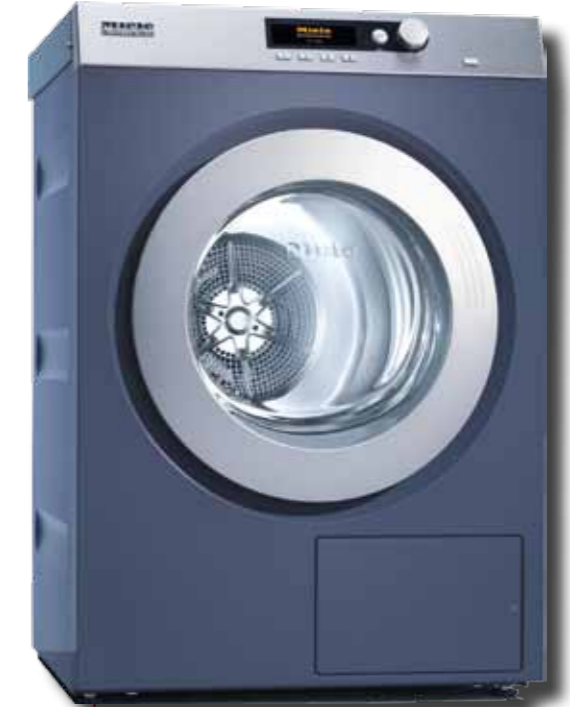
PT 7186 octoplus@