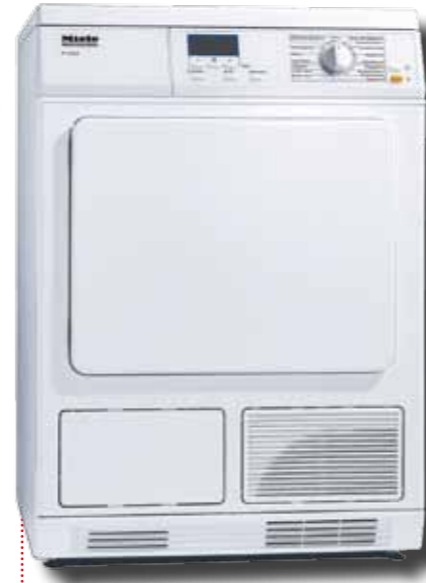
PT 5135C kondenssikuivaaja (kuvassa)